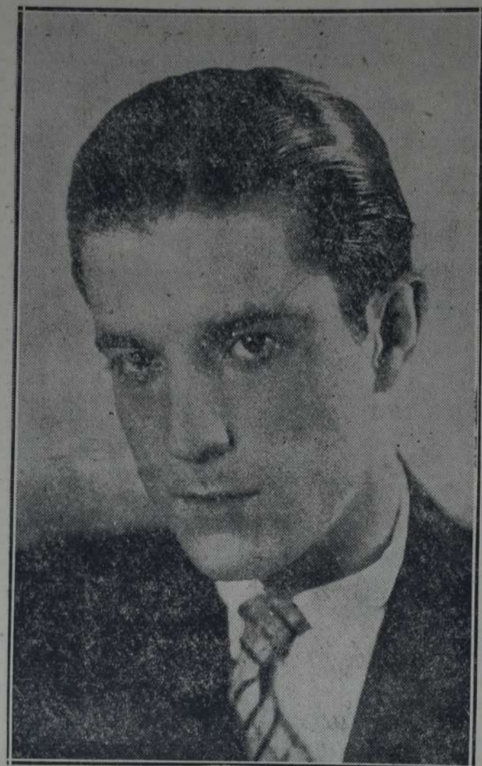
primer rango de los actores más destacados.

El debut se efectuará el lunes 23 con "Más que la honra", de Alicia Olivá. En funciones siguientes se ofrecerán "El hijo de Polichinela", y "La mariposa que voló sobre el mar", de Jacinto Benavente; "Doña Diabla", "Poca cosa es un hombre" y "Una novela vivida", y otras que alternarán con reprises en las diarias secciones vermouth.